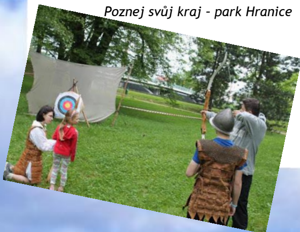
Poznej svůj kraj - park Hranice

V rámci kampaně TÝDEN PRO RODINU se uskutečnila pout' rodin na Svatý Hostýn, Den otevřených dveří v Jitřence a Poznej svůj kraj. Novou akci „POZNEJ SVŮJ KRAJ“ jsme uskutečnili v parku Sady čs. Legií v Hranicích. V parku byla rozmístěna stanoviště se zábavnými, sportovními i vědomostními úkoly, které měly inspiraci v zajímavostech našeho města a okolí. Ke spolupráci jsme pozvali skautský oddíl v Hranicích a mládež Hranického Děkanátu. Také jsme oslovili Lázně Teplice, Infocentrum Hranice a Aragonitové jeskyně s prosbou o drobné odměny pro účastníky, vyhověli nám. Děkujeme všem za ochotnou spolupráci. Tento formát akce se nám osvědčil, akci navštívily pro nás nové rodiny a více jsme vešli do povědomí rodin našeho města.