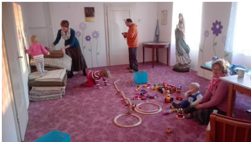
Hlídání dětí při besedě pro manželské páry, Drahotuše

Nabízíme možnost hlídání dětí pro vyřízení nezbytných záležitostí rodičů nebo v době, kdy se rodiče účastní některého programu. Oba rodiče se tak mohou účastnit našich programů. Maminky si mohou vyřídit své záležitosti, zatímco jejich děti tráví tento čas s tetami ve známém prostředí.